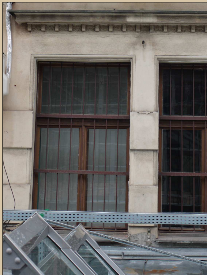
pohled na okenní mříž